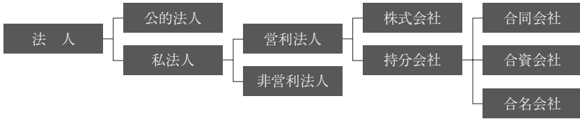
図表 1-2 日本の法人分類（略図） 筆者作成

する社会のなかでフェアに活動するためには、しかるべき法律や規制で守られなければなりません。そのため、会社組織に対しても、法のもとに平等に扱われて活動できるように「法人格」が認められるようになったのです。少し理解が困難してしまいそうですが、私たち個人は自然人であり（たいていの場合）法人となります。しかし、会社などの組織はもちろん自然人ではなく、法務局で登記することで法人となります。