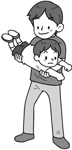
スーパーマンごっこ

保護者は、子どもの胸とももに手をあてて、子どもを持ち上げます。移動しながら、子どもを上下させると、いっそう喜びます。子どもは、手を前に突き出しても良いですし、飛行機のように翼の横に伸ばしても良いでしょう。集団で行う際は、周りに気をつけながら、友だちとすれ違ったら挨拶し、交流をしながら遊ぶことも可能です。